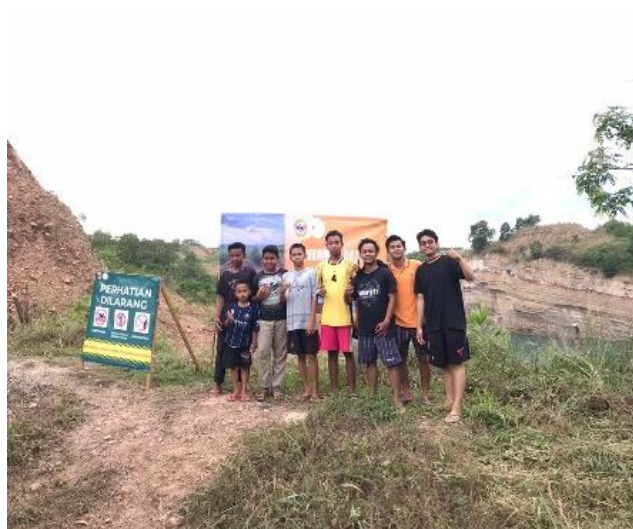
Gambar 4. Branding Wisata Danau Biru Paring Tali Melalui Pemasangan Banner Wisata

Setelah Pelaksanaan sosialisasi dilakukan branding secara bertahap melalui pemasangan banner ke danau biru (gambar 8) yang menumbuhkan motivasi masyarakat untuk mempromosikan desa wisata (gambar 9). Branding Danau Biru Paring Tali juga dipromosikan oleh media sosial wisata yang menjadikan Danau Biru Paring Tali dikenal wisatawan (gambar 10.)