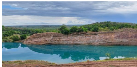
Gambar 1. Wisata Danau Biru Paring Tali yang akan dikembangkan oleh Desa Paring Tali

Setelah melaksanakan komunikasi dari berbagai aspek sebelum pelaksanaan sosialisasi dilakukan peninjauan sarana dan prasana untuk membangun Desa Wisata pada tahap rintisan. Peninjauan yang dilakukan seperti, akses jalan menuju desa (Gambar 1.) dan lahan wisata yang ingin dikembangkan oleh Desa Paring Tali (Gambar 2)