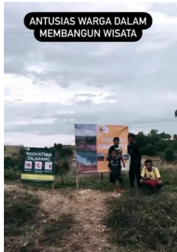
Gambar 5. Antusias Pemuda Desa Paring Tali dalam Branding Wisata Danau Biru Paring Tali