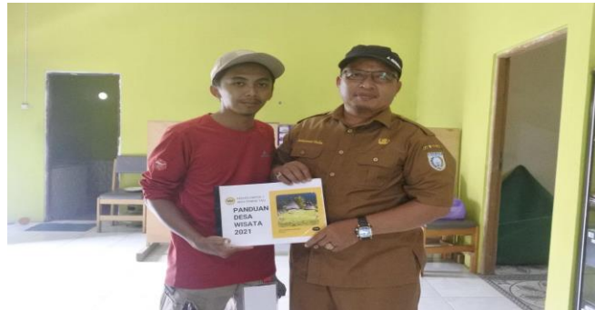
Gambar 2. Pemberian Buku Pedoman Desa Wisata

Melihat hasil dari peninjauan akses sarana dan prasarana serta wisata yang ingin dikembangkan oleh Desa Paring Tali diperlukan edukasi untuk meningkatkan peran masyarakat dalam pembangunan Desa Wisata yang memerlukan berbagai upaya pemberdayaan ( empowerment ), agar masyarakat dapat berperan lebih aktif dan optimal serta sekaligus menerima manfaat positif dari kegiatan pembangunan yang mensejahterakan masyarakat melalui Desa Wisata. Pelaksanaan Sosialisasi dilakukan secara bertahap melalui pemberian edukasi kepada aparatur desa, BPD, serta RT desa paring tali melalui pemberian buku Pedoman Desa Wisata (gambar 3.) dan Panduan Pembentukan Kelompok Sadar Pariwisata (gambar 4.)