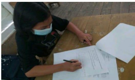
Gambar 1. Salah Satu Murid Sedang Mengerjakan Materi

Dari hasil yang didapatkan, cerita pendek memang dapat menjadi salah satu bahan atau metode ajar yang efektif untuk digunakan untuk mengajari murid – murid belajar Bahasa Inggris. Sama halnya seperti yang disimpulkan oleh Ch. Evy Tri Widyahening dan Mh. Sri Rahayu “Penggunaan cerita rakyat sebagai media pembelajaran bahasa inggris dapat meningkatkan penguasaan kosakata siswa”.